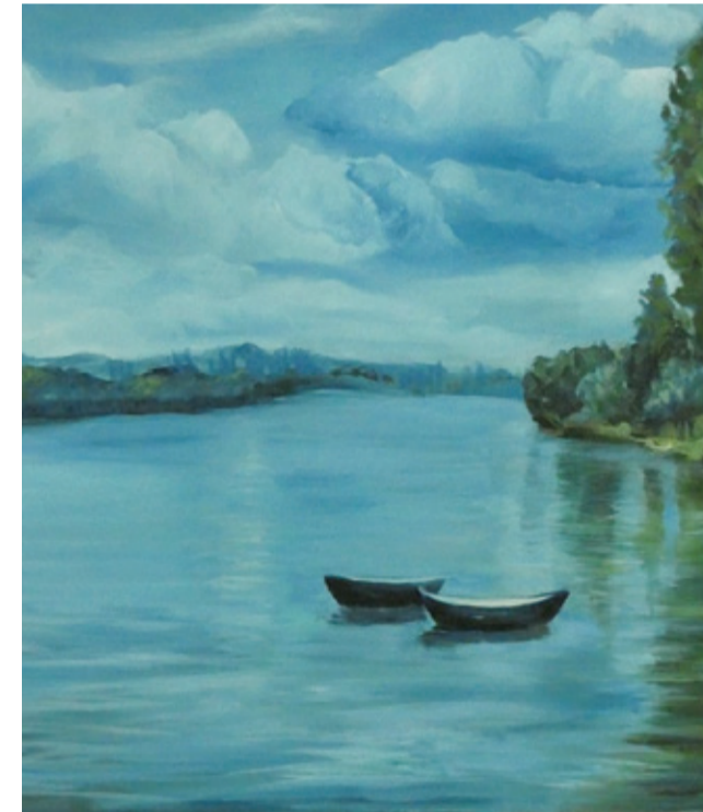
Wanda Botter namalowała jezioro w Obłężu.