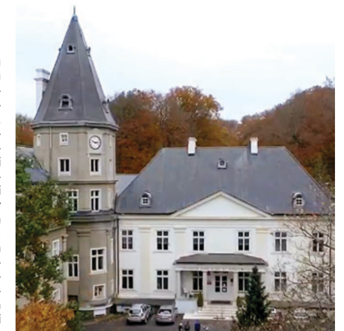
Rowerzyści odwiedzają najciekawsze zakątki gminy ukazując ich piękno i zachęcając innych do zwiedzania.