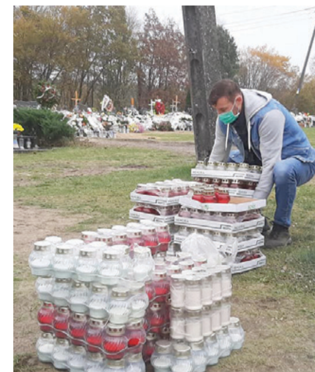
Znicze zostały kupione od lokalnych przedsiębiorców. 1 listopada zarządcy cmentarzy zapalili je na wszystkich grobach.

legającymi na zamknięciu cmentarzy, wielu naszych przedsiębiorców handlujących zniczami i kwiatami było zagrożonych sporymi stratami. – Zależało nam na zminimalizowaniu skutków pandemii i obostrzeń