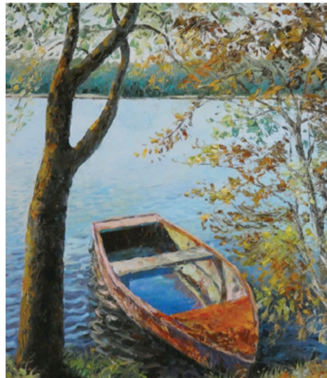
Brzeg obłęskiego jeziora według Jacka Adamczyka.