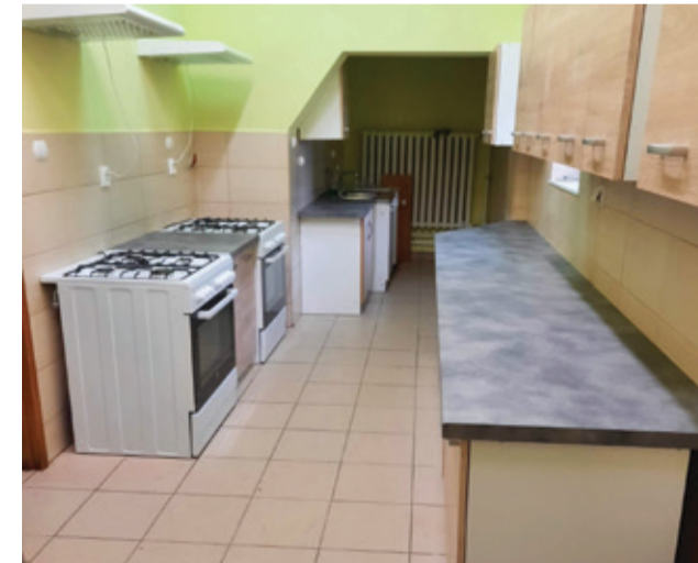
W wyremontowanej kuchni są też nowe meble oraz sprzęt AGD.

Sołectwo Biesowice w tym roku przeznaczyło z Funduszu Sołeckiego kwotę 8 tysięcy zł na wykonanie remontu kuchni znajdującej się w tamtejszej świetlicy. – Bardzo nas cieszy, że w realizowany remont zaangażowali się nasi mieszkańcy – mówi z dumą Szymon Ciepela, Sołtys Biesowic. – Wspólnie z mieszkańcami sołectwa oraz przy współpracy z OSP Biesowice wykonaliśmy montaż mebli oraz wspólnie je ustawiliśmy – dodaje sołtys. W ramach tej inwestycji zakupiono dwie kucharki gazowe z piekarnikami, lodówkę, ekspres do kawy, dwa okapy oraz meble kuchenne. Staraniem mieszkańców odświeżono także przestrzeń i wymalowano ściany. – Teraz kuchnia dostaje nowe życie i z pewnością będzie świet-