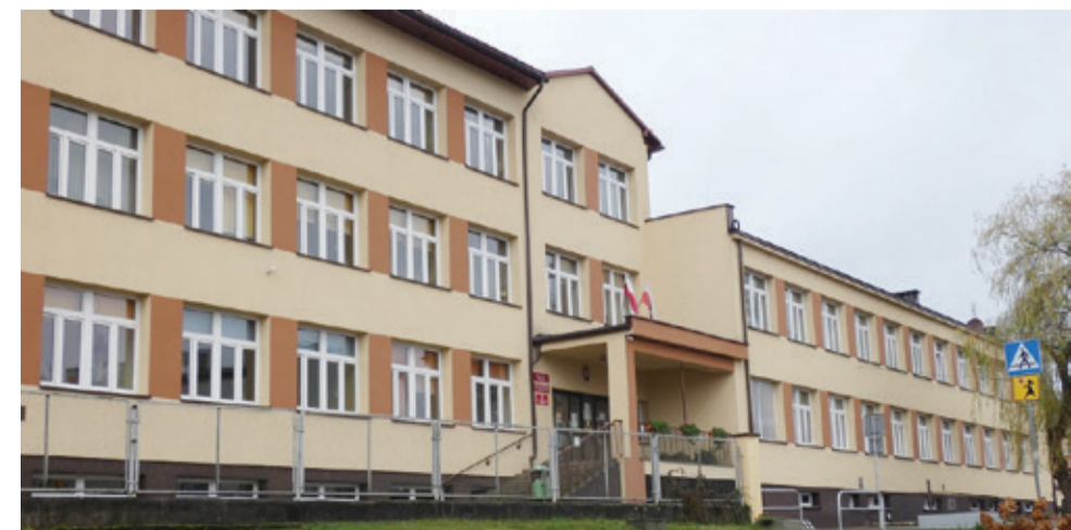
W budynku kępickiej szkoły Spółdzielnia „Teraz My” prowadzi usługi gastronomiczne.

W centrum Kępic powstało ciekawe miejsce