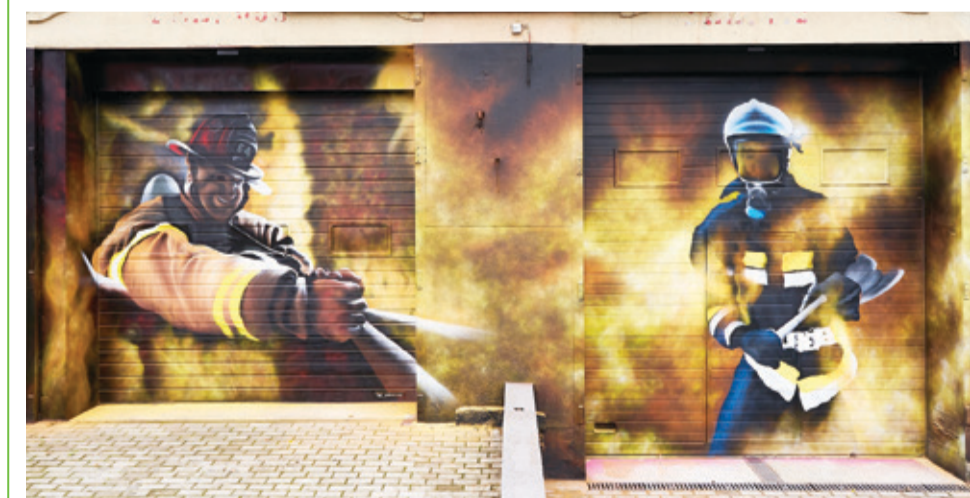
Efekty wykonanej pracy odmiennie wizerunek remizy.

Trudno ją teraz poznać. Remiza Ochotniczej Straży Pożarnej w Biesowicach diametralnie odmiennie swój dotychczasowy wygląd. Na obu bramach wjazdowych pojawiły się malunki nawiązujące do wymagającej pracy strażaka.