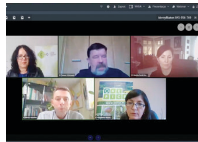
Tegoroczne kongresy ze względu na pandemię odbyły się za pośrednictwem internetu.

uczestnikami i specjalistami m.in. w dziedzinie zaburzeń rozwoju, kępicki samorządowiec dyskuutował o możliwościach aktywności i integracji w czasie pandemii oraz po jej zakończeniu. Szeroko zostały omówione kwestie możliwości działań i oczekiwań w tym okresie osób z niepełnosprawnościami. Z pewnością wnioski płynące z tegorocznego konwentu, przyczynią się do podjęcia działań zgodnych z oczekiwaniami tych osób.