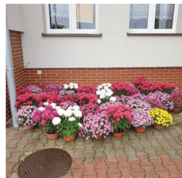
Kępicki samorząd odkupił także kwiaty od naszych handlowców, aby zminimalizować straty.

dodaje. Przedstawiciele zarządców cmentarzy podjęli w dniu 1 listopada wyjątkową inicjatywę. Na wszystkich cmentarzach – w Kępicach, Barcinie, Korzybiu, Płocku i Biesowicach zapalali znicze na każdym grobie. W trakcie tego dnia łącznie zapłonęło ponad 3 tysiące świec, aby choć w taki sposób ulżyć osobom które przeżywają brak osobistej możliwości pojawienia się na cmentarzu. Co ważne, znicze zostały zakupione u lokalnych przedsiębiorców, aby także wesprzeć ich działalność. – Bardzo dziękuję za to zaangażowanie. Jestem bardzo wdzięczna za udział w tej inicjatywie i jestem przekonana, że ten niezwykle gest dodał wielu naszym mieszkańcom otuchy w tym trudnym czasie – mówi Magdalena Majewska, Burmistrz Kępice. W związku z obostrzeniami wprowadzonymi w ostatnich dniach, po-