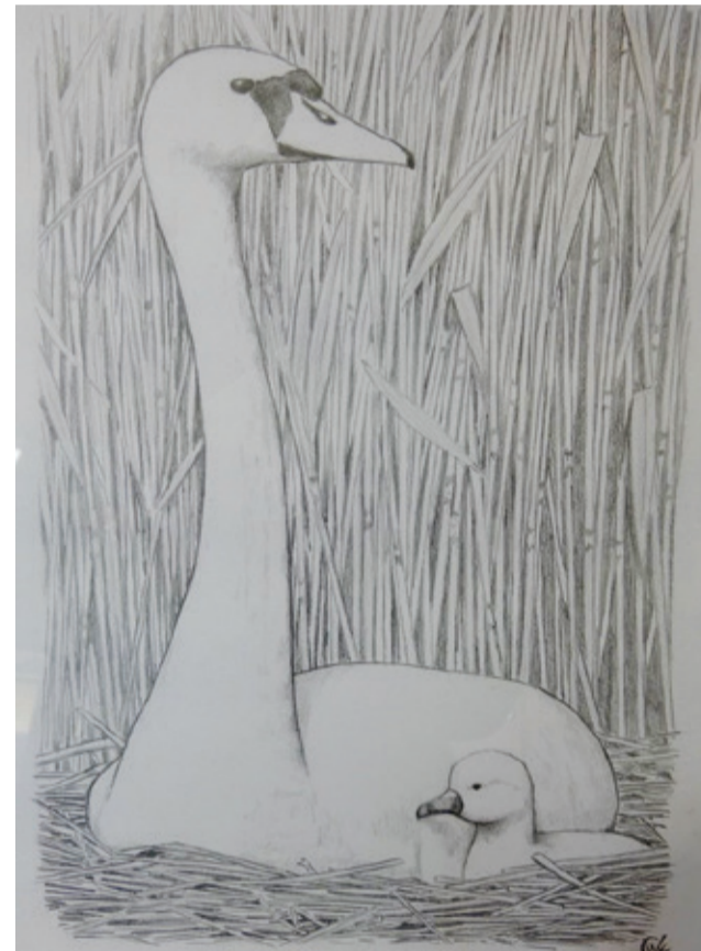
Autorem tego obrazu jest Wojciech Czubajewski.