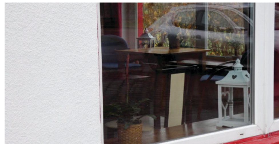
Przy ulicy Sikorskiego 18 w Kępicach działa także Rollo Bar.

mediach społecznościowych. Lokal zapewni dowóz na telefon - kontakt 574 460 457. Jak widać oferta naszych przedsiębiorców jest bardzo szeroka i dostosowana do wielu gustów i potrzeb. Zachęcamy naszych mieszkańców do korzystania z usług lokalnej gastronomii.