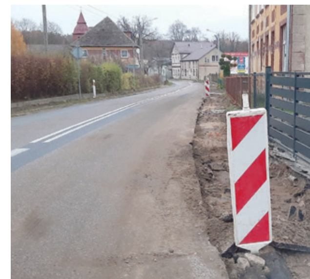
Chodnik w Barcinie w trakcie remontu.

Zarząd Dróg Wojewódzkich przewidział m.in. rozebranie dotychczasowych płyt chodnikowych ze względu na liczne nierówności i zagłębienia. Nawierzchnia nowego chodnika zostanie wykonana z kostki betonowej wraz z wzmocnieniem istniejącej podbudowy. Przypomnijmy, że w ramach udanej współpracy z Samorządem Województwa Pomorskiego w ostatnim czasie został zmodernizowany kilometrowy odcinek drogi między Warcinem a Osowem, a także wybudowano chodnik w Kępicach od wiaduktu w kierunku ulicy Składowej. – Współ-