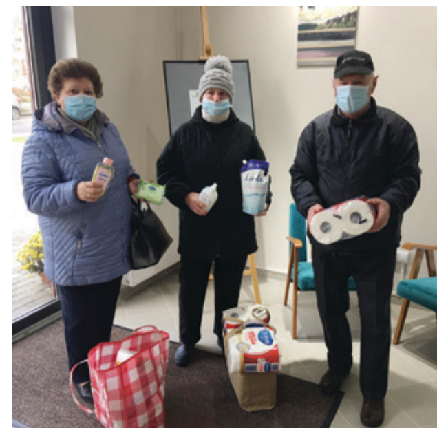
Kępiczanie odpowiedzieli na apel słupskiego szpitala.