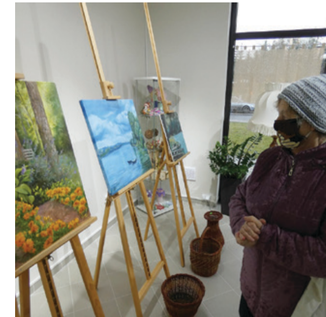
Obrazy przykuwają uwagę zwiedzających.