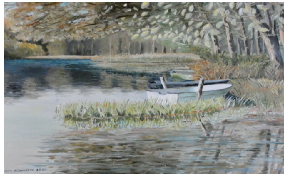
Tak jezioro obłęskie namalowała Alicja Adamczyk.