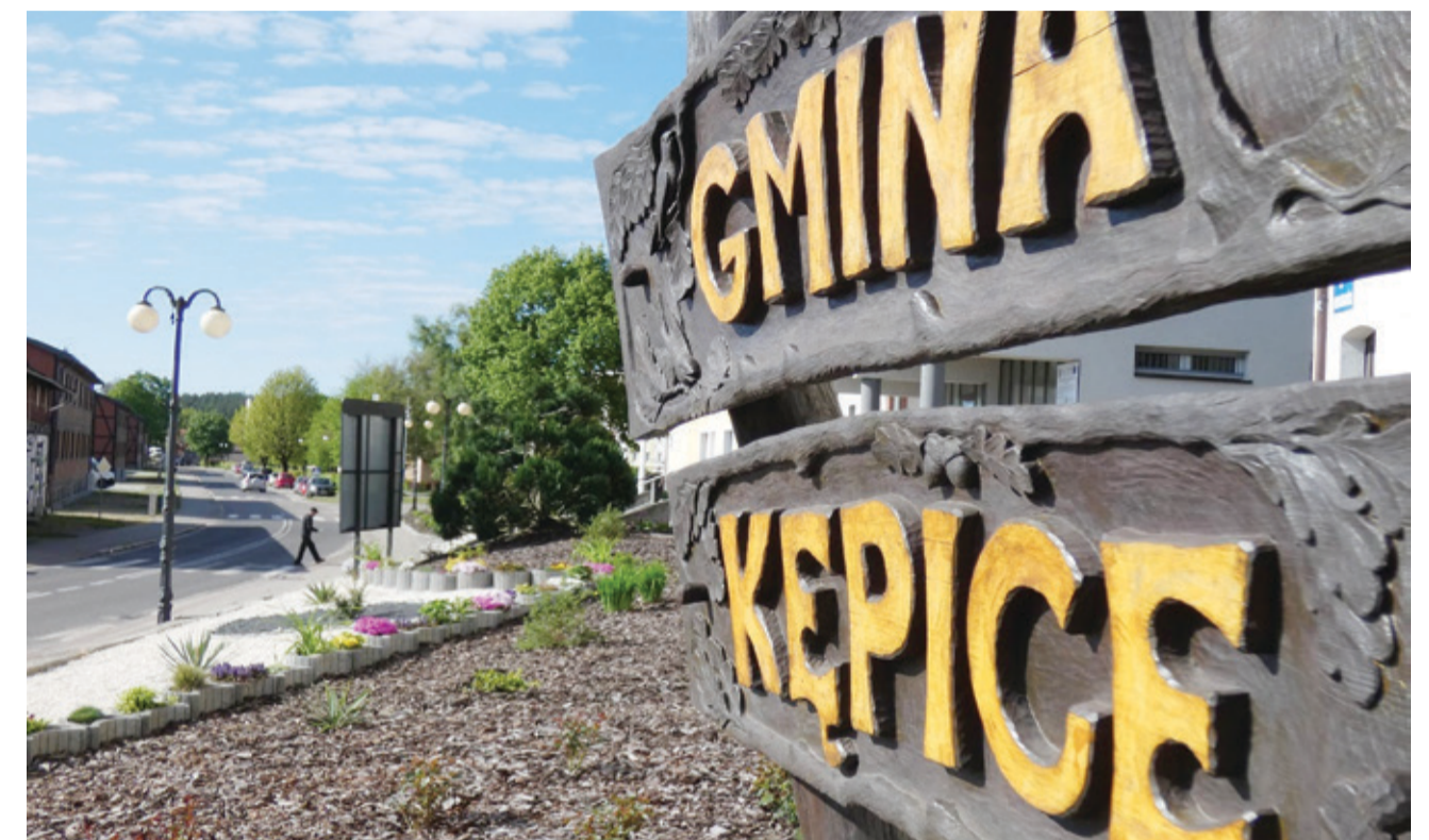
W naszej gminie będzie realizowany nowy projekt. Tym razem będziemy walczyć z ograniczeniami.

problemami związanymi z transportem i komunikacją publiczną. Aż do 18 z 36 miejscowości w gminie nie dociera żaden przewoźnik – dodaje Piszko – Bojaryn. Wdrożona usługa pozwoli mieszkańcom bezpłatnie dotrzeć np. do lekarza, urzędu, na rehabilitację czy załatwić istotne sprawy w instytucjach nie tylko na terenie naszej gminy. Otrzymane dofinansowanie pozwoli na zakup samochodu przystosowanego do przewozu osób z niepełnosprawnościami. Projekt zakłada ścisłą współpracę ze Spółdzielnią Socjalną „Razem”, która będzie odpowiadać za realizację usługi od strony organizacyjnej. Dodatkowo planujemy zatrudnienie kierowcy oraz asystenta osób z niepełnosprawnościami, którzy zostaną przeszkoleni z zasad udzielania pierwszej pomocy przedmedycznej. – Stuprocentowe dofinansowanie jakie otrzymamy na realizację przedsięwzięcia nie obciążą naszego budżetu,