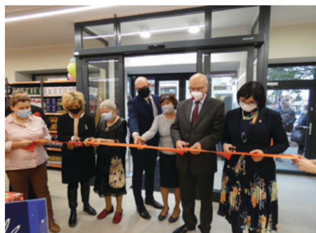
Oфіcjalne otwarcie sklepu „Gama” w Kępicach.

W Kępicach powstają nowe punkty handlowe i usługowe.