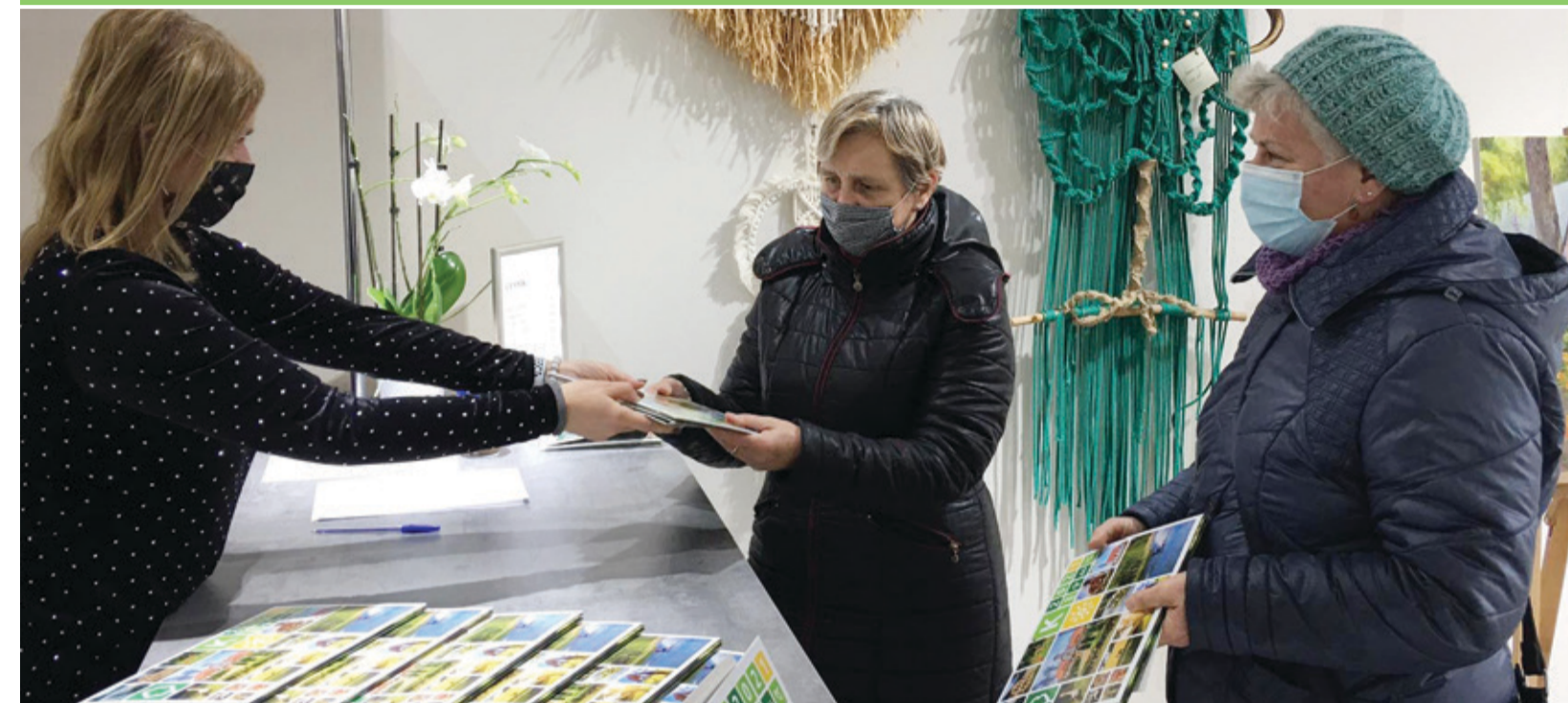
Upominki cieszą naszych gości.