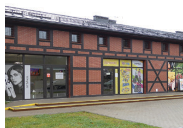
Nowe punkty handlowo – usługowe prężnie działają w budynkach przy ul. Niepodległości.