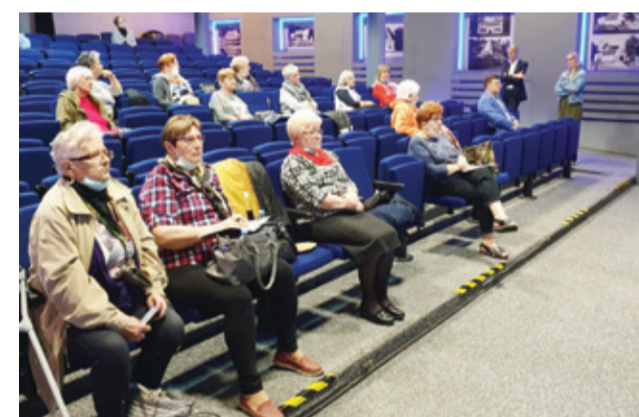
Uczestnicy warsztatów dowiedzieli się m.in. jak na co dzień żyć według ekologicznych zasad.

projekcie należy być mieszkańcem Gminy Kępice w wieku powyżej 45 lat. Zachęcamy do skorzystania z oferty – nr tel. 59 857 66 21, e-mail: achristyńniuk@kepice.pl.