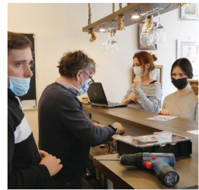
W trakcie montażu pętli indukcyjnej w galerii ArtCafe w Kępicach.

Zainstalowanie pętli indukcyjnej zostało sfinansowane w ramach projektu „Kępcice bez barier” – usługi indywidualnego transportu door to door oraz poprawa dostępności architektonicznej wielorodzinnych budynków będących w zasobach gminy. Projekt finansowany jest ze środków UE w ramach Działania 2.8. Rozwój usług społecznych świadczonych w środowisku lokalnym Programu Operacyjnego Wiedza Edukacja Rozwój 2014-2020 w ramach konkursu organizowanego przez Państwowy Fundusz Rehabilitacji Osób Niepełnosprawnych.