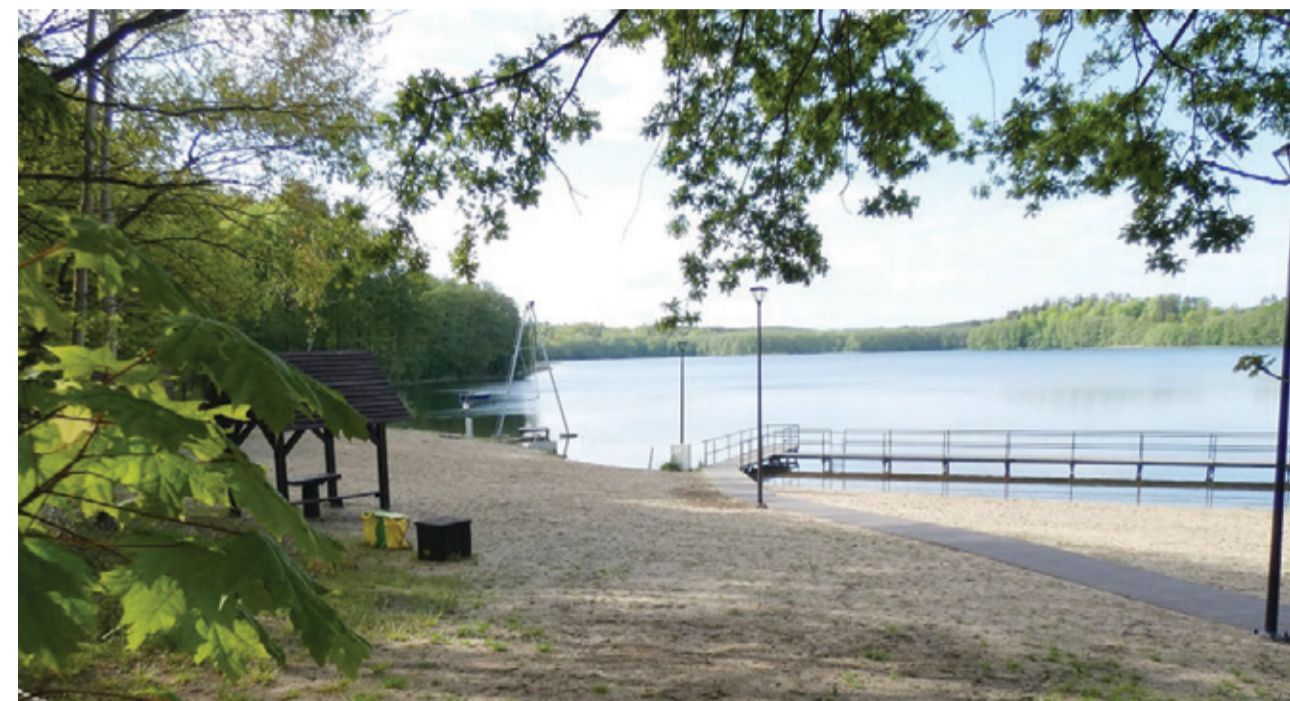
Projekt „Obłędnie aktywni” będzie realizowany nad brzegiem jeziora Obłęskiego w wakacyjnych miesiącach.

Projekt na zajęcia prozdrowotne nad jeziorem Obłęskim zyskał wsparcie finansowe Powiatu Słupskiego. Latem ruszą zajęcia w malowniczym miejscu.