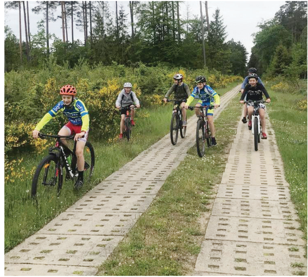
Młodzi ludzie mogą dołączyć do już trenujących kolegów. Trwają zapisy.