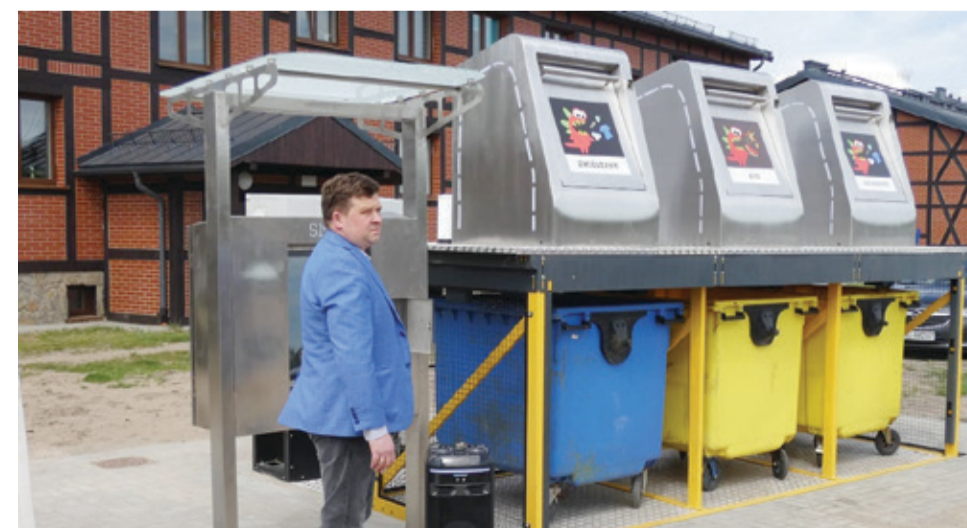
Dziennikarzom zaprezentowano funkcjonowanie systemu.

Projekt „Kępickie śmieci w Ekosieci – innowacyjny system zarządzania gospodarką odpadami” jest współfinansowany ze środków Funduszu Spójności w ramach Programu Operacyjnego Pomoc Techniczna na lata 2014-2020 - konkurs ogłoszony przez Ministerstwo Rozwoju skierowany do jednostek samorządu terytorialnego pod tytułem: „HUMAN SMART CITIES. Inteligentne miasta współtworzone przez mieszkańców”.