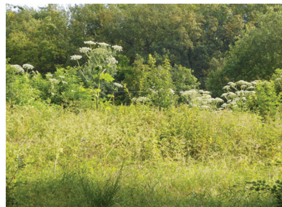
Z barszczem Sosnowskiego walczymy w naszej gminie już od wielu lat. Zdobyliśmy kolejne środki na kontynuację zwalczania tego intruza.

Projekt nie będzie polegał jedynie na zwalczaniu gatunków in-