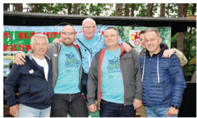
Każda edycja tego biegu przyciąga wielu miłośników sportu.

głównego zostaną wystartowani o godz. 11. Zgłoszenia uczestników XXVII Biegu im. Elżbiety Garduły przyjmowane są przy użyciu formularza internetowego znajdującego się na stronie internetowej www.biegimj.pl i będą przyjmowane do godz. 23:59 dnia 30.06.2021 r.