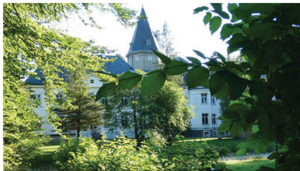
W naszej grze promującej zabytki znajdzie się m.in. pałac w Warcinie.

Kolejny nasz projekt uzyskał finansowe wsparcie przyznane przez Zarząd Powiatu Słupskiego. Tym razem dofinansowanie jest efektem wygranej otwartego konkursu w zakresie działań na rzecz kultury, sztuki i dziedzictwa narodowego. – Nasz projekt zakłada stworzenie specjalnej gry edukacyjnej memory, w której zaprezentujemy 15 zabytków zlokalizowanych na terenie powia-