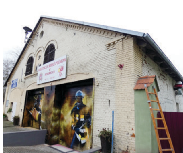
Budynek remizy w Biesowicach dzięki pozyskanym środkom zostanie wyremontowany.