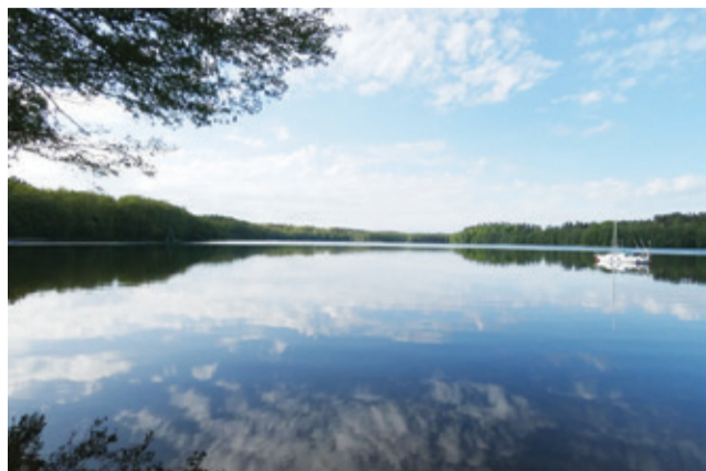
Półkolonie odbędą się nad jeziorem Obłęskim.

Kolejne pozyskane środki, pozwolą zorganizować półkolonie dla dzieci. To będzie wypoczynkowy połączony z edukacją rybacką.