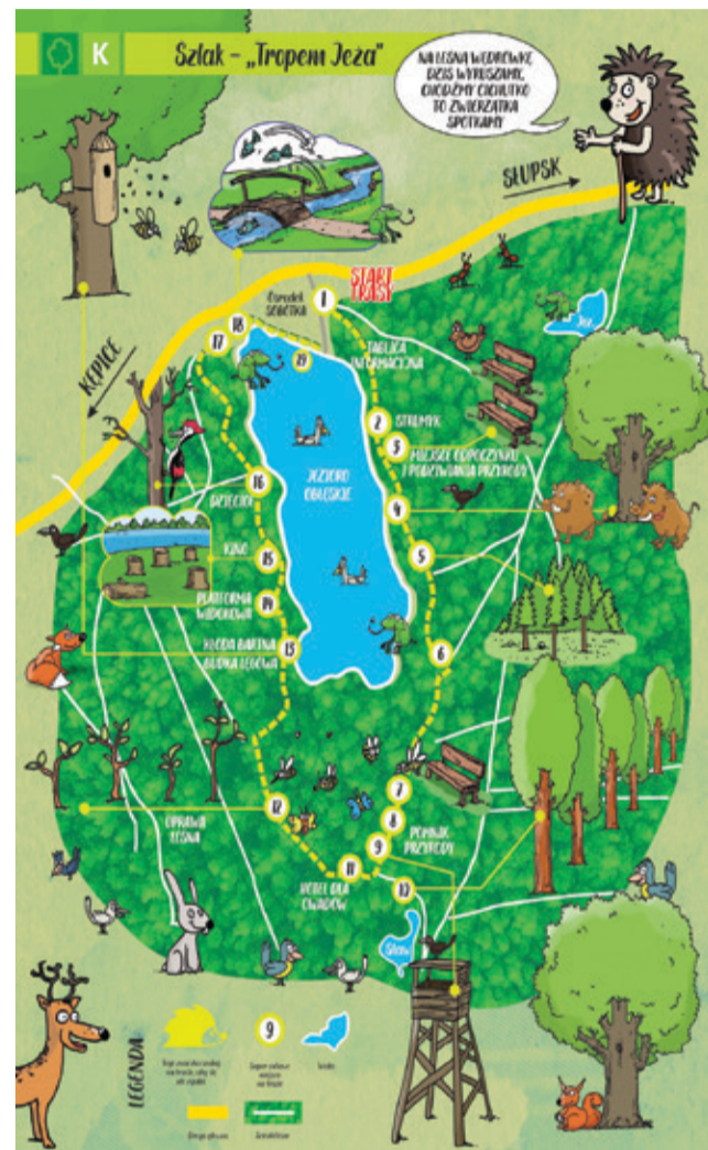
Mapkę z wyjątkowym szlakiem można nieodpłatnie otrzymać w recepcji Ośrodka Wypoczynkowego „Sobótka”.