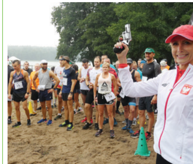
Bieg „Zielona dycha”, który odbył się w 2020 roku.

Ruszyły zapisy na kolejny, ważny bieg. Startujemy na początku lipca.