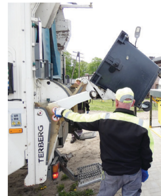
Podczas prezentacji działania kępickiego SMOKA.

worki z odpadami. Użytkownik następnie skanuje kod kreskowy przy kiosku wrzutowym dla odpowiedniej frakcji i po otwarciu klapy wrzuca worek z odpadami wraz z naklejonym kodem kreskowym. – Co ważne, w systemie podziemnym jest również zainstalowana waga do kontroli ilości odpadów dla celów sprawozdawczych. Połączenie koszty podziemnych z innowacyjnym oprogramowaniem utworzonym w ramach projektu SMOK wraz z wagą i kodem kreskowym umożliwiają pomiar ilości i identyfikację odpadów wrzucanych