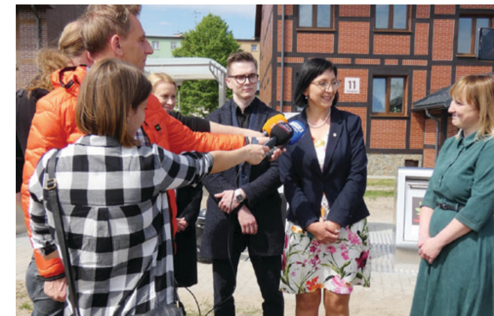
W konferencji prasowej wzięli udział kępiccy samorządowcy i naukowcy z Politechniki Gdańskiej.