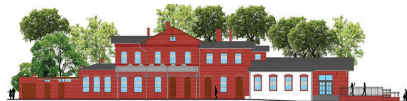
Wizualizacja budynku Centrum Przesiadkowego od strony peronów.

Dlatego zaplanowano wybudowanie minikina, którego sala pomieści około 25 osób. To ciekawa alternatywa nie tylko dla mieszkańców, ale także dla podróżujących, którzy oczekują na przesiadkę. Nie zabraknie także kawiarni oraz pomieszczeń usługowych do wynajęcia. Zaplanowano także ogólnodostępną dla mieszkańców toaletę (w miejscu wcześniejszej lokalizacji). Na piętrze obiektu powstanie świetnie wyposażona