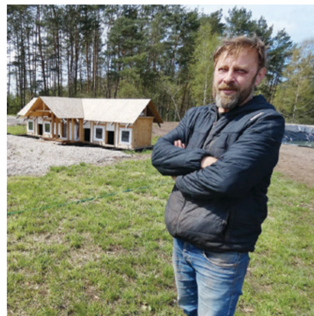
Prace budowlane na terenie ośrodka wciąż trwają. Niebawem zamieszkają tu zwierzęta.