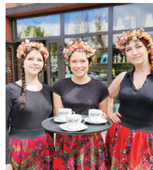
W Ogródku Artystycznym na Klientów czeka przemiła obsługa.