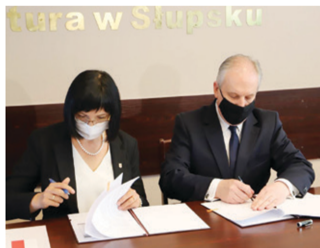
W maju samorządowcy podpisali w Wojewodę Pomorskim umowę na dofinansowanie modernizacji gminnych dróg.