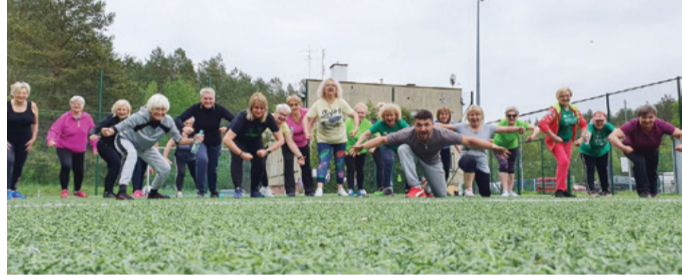
Uczestnicy zajęć zawsze mogą liczyć na znakomity humor trenera i doskonale dobrą zestawę ćwiczeń.

sobą dobre samopoczucie, wygodne obuwie, dres i butelkę wody.