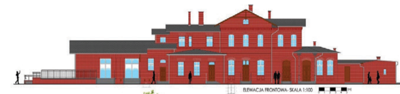
Wizualizacja budynku Centrum Przesiadkowego od ulicy Niepodległości.