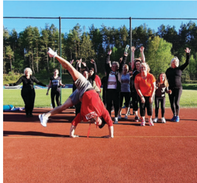
W zajęciach rekreacyjnych bierze udział coraz więcej mieszkańców. Oferta jest różnorodna.

dowodzą, że mieszkańcy doceniają proponowaną ofertę. Zajęcia są bezpłatne, zachęcamy wszystkich do korzystania z wielu propozycji. Z pewnością każdy znajdzie coś dla siebie. – Bardzo mnie cieszy, że po wykonanych ćwiczeniach widać na twarzach zadowolenie i satysfakcję. To dla mnie ważne, aby ludzie czuli się zdrowiej i wracali do domów z uśmiechem – dodaje animator. Wszyscy, któ-