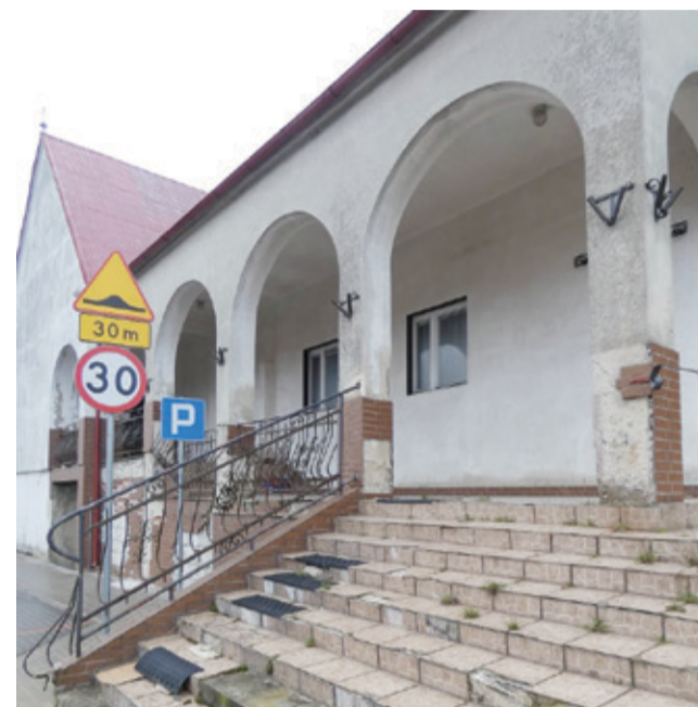
Budynek po dawnym kościele w Warcinie będzie miał nowe funkcje.

skutki ich likwidacji znacząco przyczyniły się do ekonomicznych trudności byłych pracowników. – Plany mamy bardzo szerokie w zakresie przywrócenia świet-